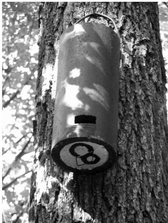
Obr. 2. Drevobetónová búdka pre netopiere v bukovo-dubovom lesnom poraste v Kováčovskej doline (Kremnické vrchy, stredné Slovensko).